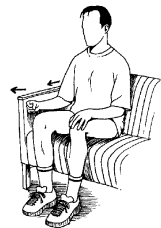
Lätt tryck utåt

Om smärtan/besvären inte blivit bättre inom 2-4 veckor, ta gärna kontakt med sjukgymnast/fysioterapeut inom Rehab Öppenvård på gamla sjukhuset i Norrtälje. Boka tid via 1177.se eller hemsidan www.tiohundra/rehabilitering , välj e-tjänster och logga in med mobilt bank-id eller annan e-legitimation. Du kan också boka tid på telnr. 0176-32 64 44.