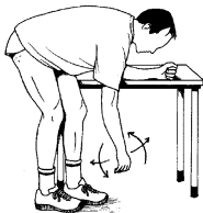
Pendla med armen 10 ggr

Syfte med träningen är att påskynda läkningsprocessen genom att övningarna ökar cirkulationen i axeln. En eventuell ökning av smärtan i samband med träningen är normalt men den bör ha klingat av före nästa träningstillfälle. Träna 2-3 ggr/dag.